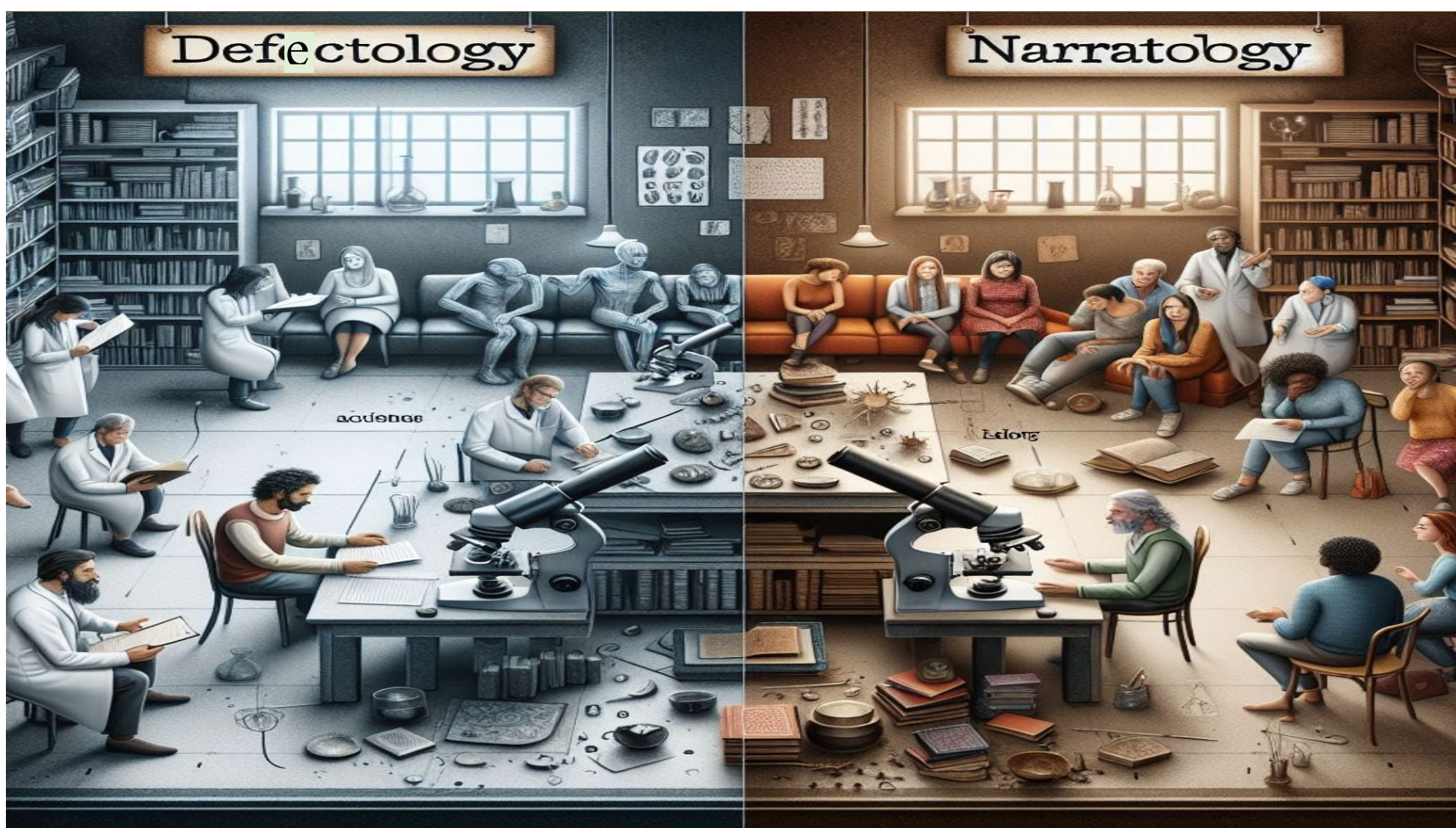
“Ci preoccupavamo troppo della ‘difettologia’ e troppo poco della ‘narratologia’, la scienza del concreto, così trascurata e così necessaria”. Oliver Sacks. Il caso di Rebecca. da “L’uomo che scambiò la moglie per un cappello”